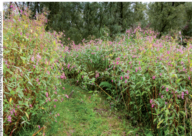
Impatiens glandulifera

Die Beispiele zeigen, dass die Bekämpfung von Neobiota häufig sehr aufwendig sowie zeit- und kostenintensiv ist. Eine bedeutende Managementmaßnahme von Neophyten ist daher Prävention, beispielsweise in Form von Monitoring, um einer Einschleppung und Ausbreitung frühzeitig vorzubeugen. Mittel zur Verhinderung negativer Effekte durch Neobiota finden sich im „Aktionsplan Neobiota“ des BMLFUW aus 2004, der alle betroffenen Organisationen und Institutionen auffordert, sein Ziele und Maßnahmen in ihren Tätigkeiten zu berücksichtigen.