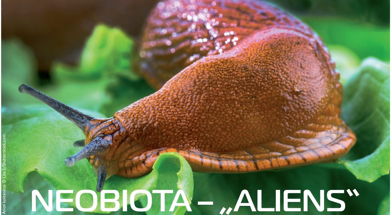
Arton Iustanovic © Lisa S. Shutterstock.com