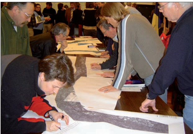
Bei der Arbeitsgruppensitzung im Rahmen der Öffentlichkeitsbeteiligung zur Umsetzung der WRRL im Teilbearbeitungsgebiet des Wutach-Flusses konnten TeilnehmerInnen Ideen, Anregungen, Verbesserungen und Kritik direkt in Karten und Luftbilder einzeichnen. 4

Die Grundsätze der Öffentlichkeitsbeteiligung einzuhalten bedeutet: 5