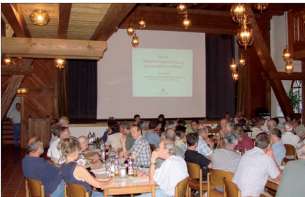
Öffentlichkeitsbeteiligung sollte so früh wie möglich stattfinden. 7

CIPRA Alpenkonventionsbüro, Alpenschutzverband, BirdLife Österreich, Forum Wissenschaft und Umwelt, Naturschutzbund Österreich, Oesterreichischer Alpenverein, Naturfreunde Österreich und International, Österreichische Alpenvereinsjugend, Österreichischer Fischereiverband, Österreichische Naturschutzjugend, Österreichisches Jugendrotkreuz, Österreichischer Touristenklub, Österreichische Wasserschutzwacht, Verband der Österreichischen Arbeiter-Fischereivereine, Verband der Österreichischen Höhlenforscher und andere hochkarätige ExpertInnen.